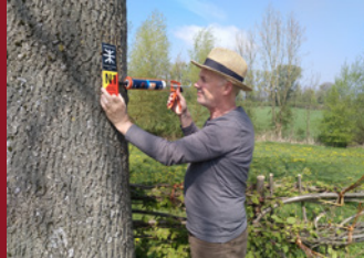
Markierungen an Wanderwegen