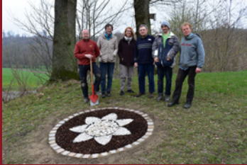
Dankeschön an alle Ehrenamtlichen