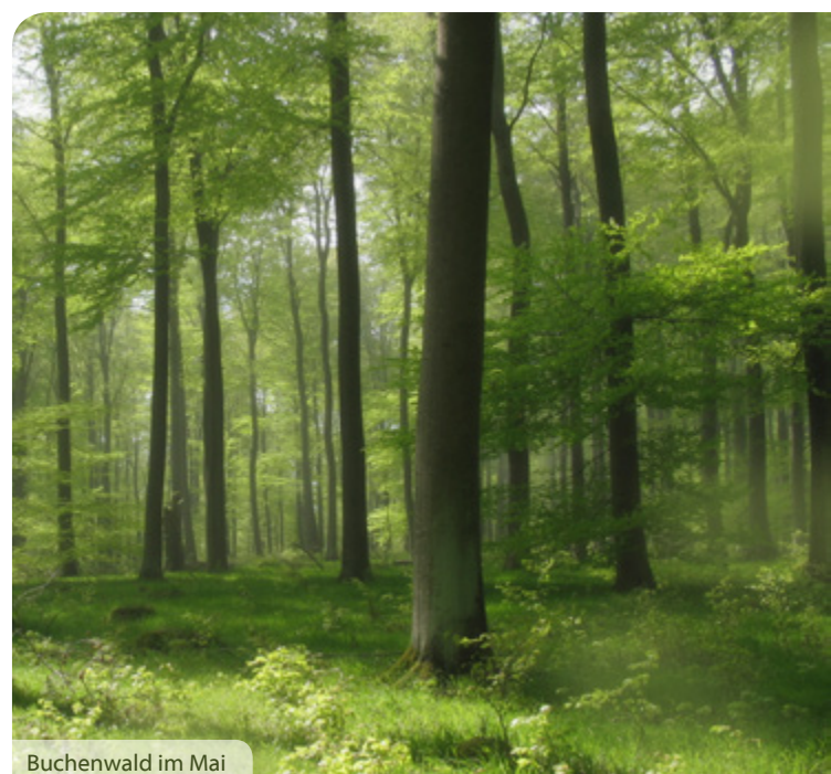
Buchenwald im Mai