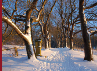
Winter im Kulturland