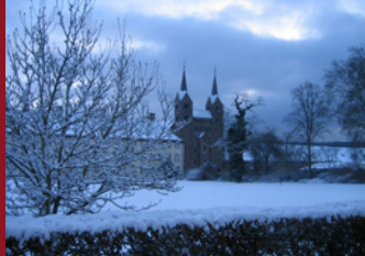
Corvey im Winter