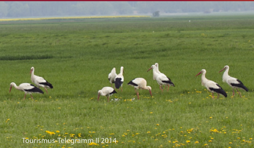
Tourismus-Telegramm II 2014